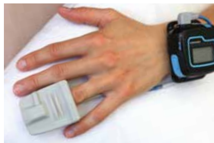
SpO 2 -Sensor, zur Messung nachts

Dank der Aufzeichnung des vom EKG abgeleiteten Atmungsaktivitätssignals sucht der medilog®AR nach möglichen Unterbrechungen der Atmungsaktivität während des Schlafs. Der optionale SpO 2 -Sensor bringt zusätzliche Information zur Atmungsaktivitätsbewertung und wird via Bluetooth verbunden.